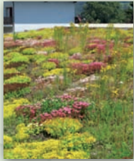
Toitures terrasses végétalisées

UN MÉTIER OÙ VOTRE SAVOIR-FAIRE SERA INDISPENSABLE POUR RÉALISER CES DIFFÉRENTS TYPES D'OUVRAGES :