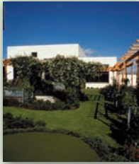
Terrasses - jardins