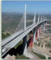
Ouvrages d'art / Ponts