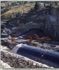
Ouvrages d'art / Tunnels